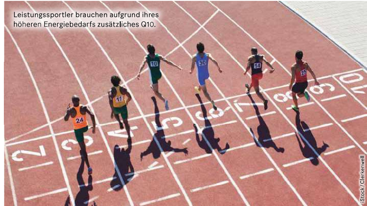
Leistungssportler brauchen aufgrund ihres höheren Energiebedarfs zusätzliches Q10.

Lässt sich denn über die Ernährung eine ausreichende Zufuhr von Q10 gewährleisten? Nein, da es sich beim Coenzym Q10 um eine körpereigene